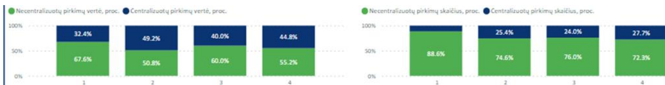
2024 m. I-IV ketv. centralizuotų tarptautinių ir supaprastintų pirkimų dalis