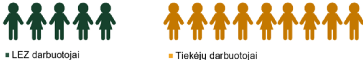
5 pav. Papildomas LEZ įmonių poveikis, kuriantis darbo vietas. Šaltinis: „Investuok Lietuvoje“ vertinimas, remiantis Statistikos departamento ir TDS duomenimis, 2018 m.

2018 m. vienas LEZ darbuotojas vidutiniškai lemdavo 97 tūkst. Eur 8 pajamų tiesioginiams LEZ įmonių tiekėjams. Tai didelė suma, atsižvelgiant į tai, jog pajamos vienam Lietuvos darbuotojui 2018 metais siekė apie 55 tūkst. Eur 9 . Taigi galima teigti, kad penkios darbo vietos LEZ įmonėse vidutiniškai sukurdavo papildomas kone 9 darbo vietas tiekėjų įmonėse (5 pav.).