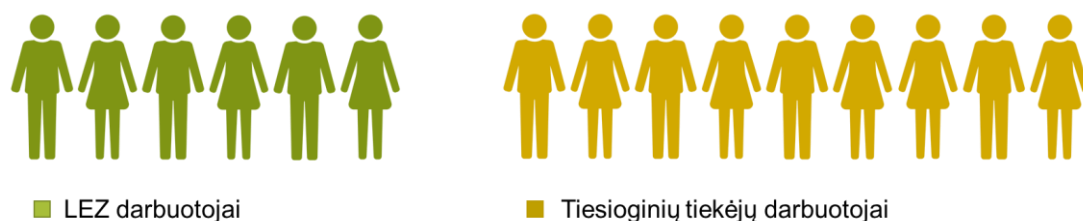
4 pav. Papildomas LEZ įmonių poveikis, kuriantis darbo vietas.

2019 m. vienas LEZ darbuotojas vidutiniškai lemdavo 89 tūkst. Eur 6 pajamų tiesioginiams LEZ įmonių tiekėjams. Tai didelė suma, atsižvelgiant į tai, jog pajamos vienam Lietuvos darbuotojui 2019 metais siekė apie 62 tūkst. Eur 7 . Taigi galima teigti, kad šešios darbo vietos LEZ įmonėse vidutiniškai sukurdavo papildomas kone 9 darbo vietas tiekėjų įmonėse (4 pav.).