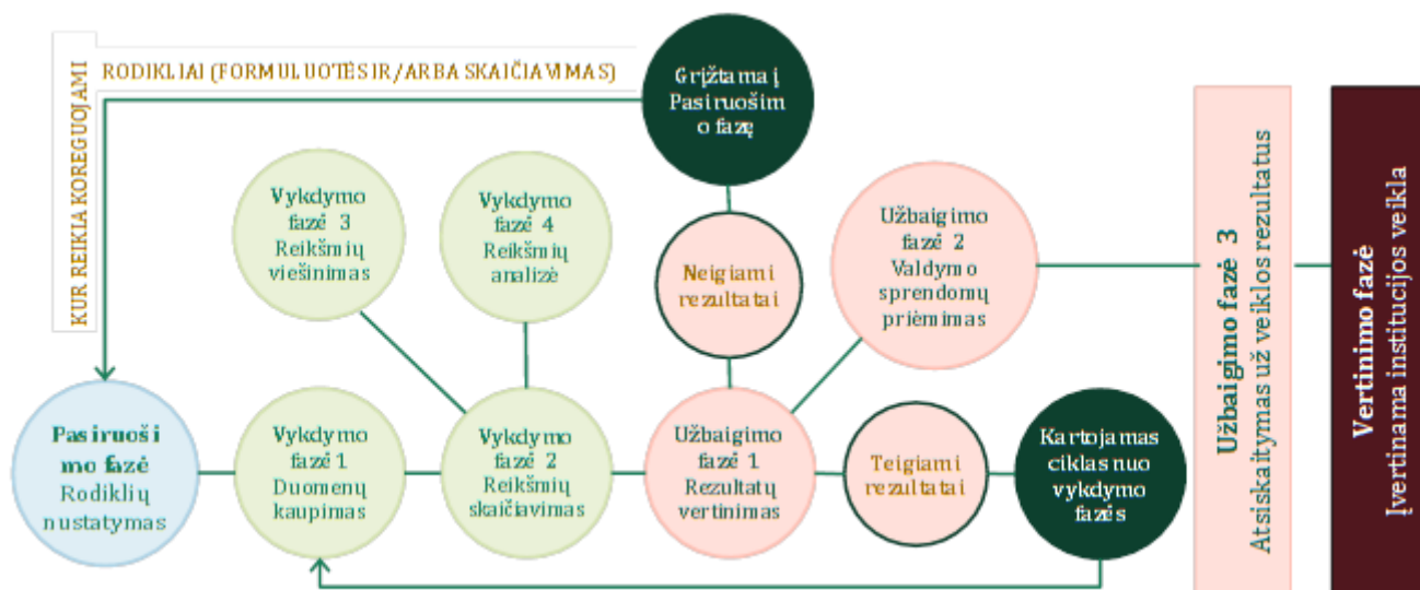
3 paveikslas. Rodiklių diegimo ir taikymo proceso ciklas

Ciklą galima sąlyginai suskirstyti į keturias pagrindines dalis (fazes):